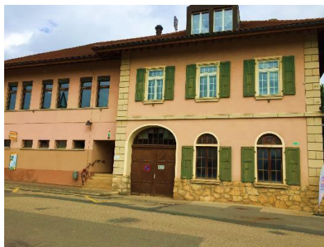
Giez en face de l'école

- Champagne : Semo Nord à Yverdon-les-Bains