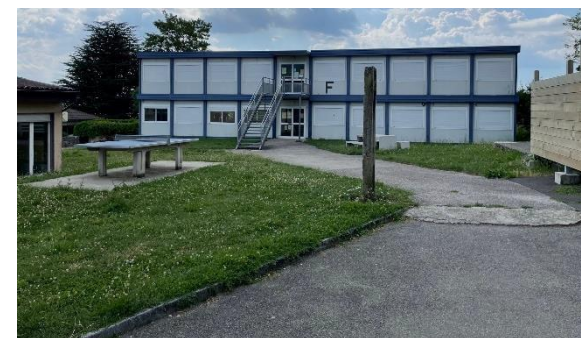
Grandson Borné-Nau F