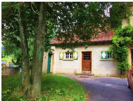
Champagne Salle de Paroisse