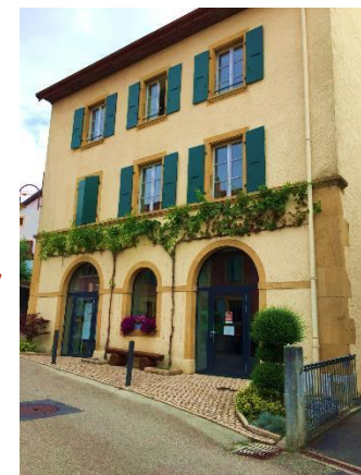
Montagny Rez-de-chaussée Ancien collège